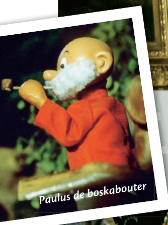
Paulus de boskabouter