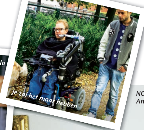
Je zal het maar hebben