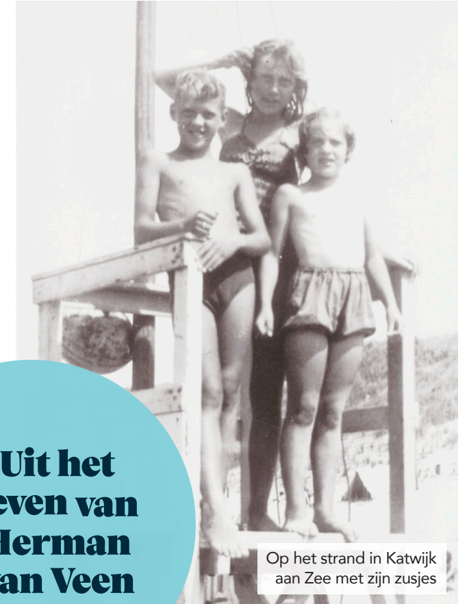
Op het strand in Katwijk aan Zee met zijn zusjes