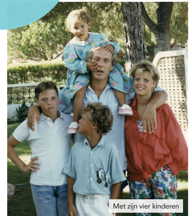
Met zijn vier kinderen