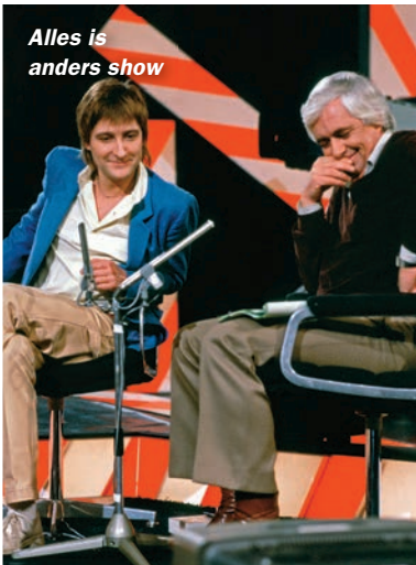
Alles is anders show