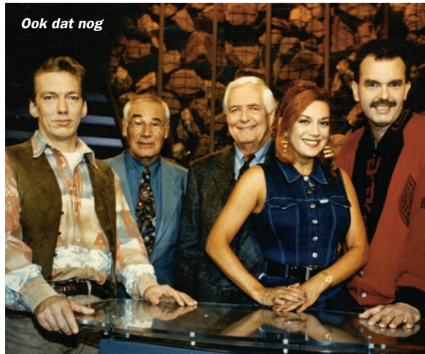
Ook dat nog