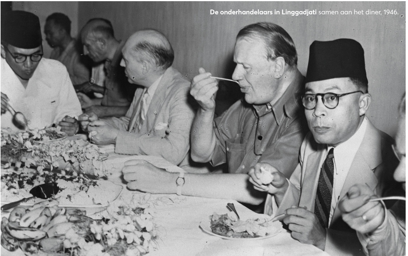
De onderhandelaars in Linggadjati samen aan het diner, 1946.

hadden, nam toe. Intussen belandde het land door wanbeleid in een economische crisis. Omdat Rachmad Nederland goed kende en een Nederlandse vrouw had, verzocht Soekarno hem ambassadeur in Den Haag te worden. Wellicht kon hij bij de voormalige kolonisator steun lospeuteren.