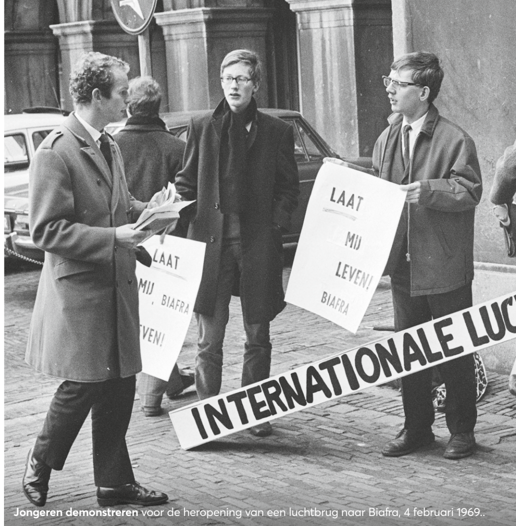
Jongeren demonstreren voor de heropening van een luchtbrug naar Biafra, 4 februari 1969..

Groot-Britannië. De Britten stuurden vliegtuigen om zo hun investeringen in de oliesector veilig te stellen. De Verenigde Staten hielden zich afzijdig; die hadden hun handen vol aan Vietnam en hadden geen behoefte aan nog een conflict. Andere partijen steunden Biafra. Zoals de rooms-katholieke kerk, die de burgeroorlog zag als een conflict tussen moslims en christenen. En 'roomse' naties als Spanje, Portugal en Frankrijk verleenden Biafra militaire steun. Net als Zuid-Afrika, Israël en Rhodesië, die belang hadden bij een 'verzwakt' Nigeria.