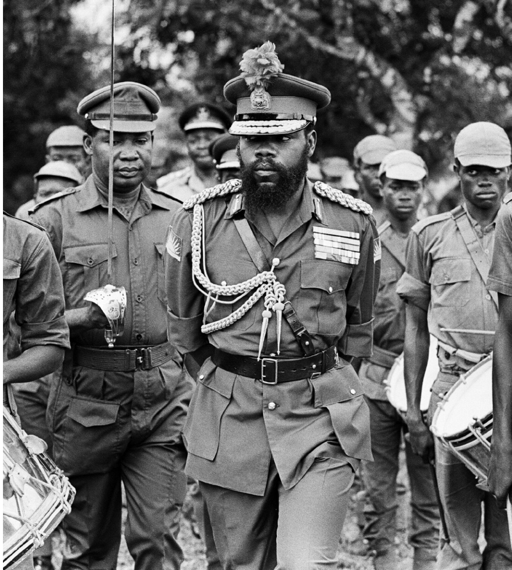
Emeka Ojukwu, de gouverneur van Biafra, inspecteert zijn troepen, 11 juni 1968.