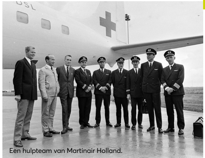
Een hulpteam van Martinair Holland.