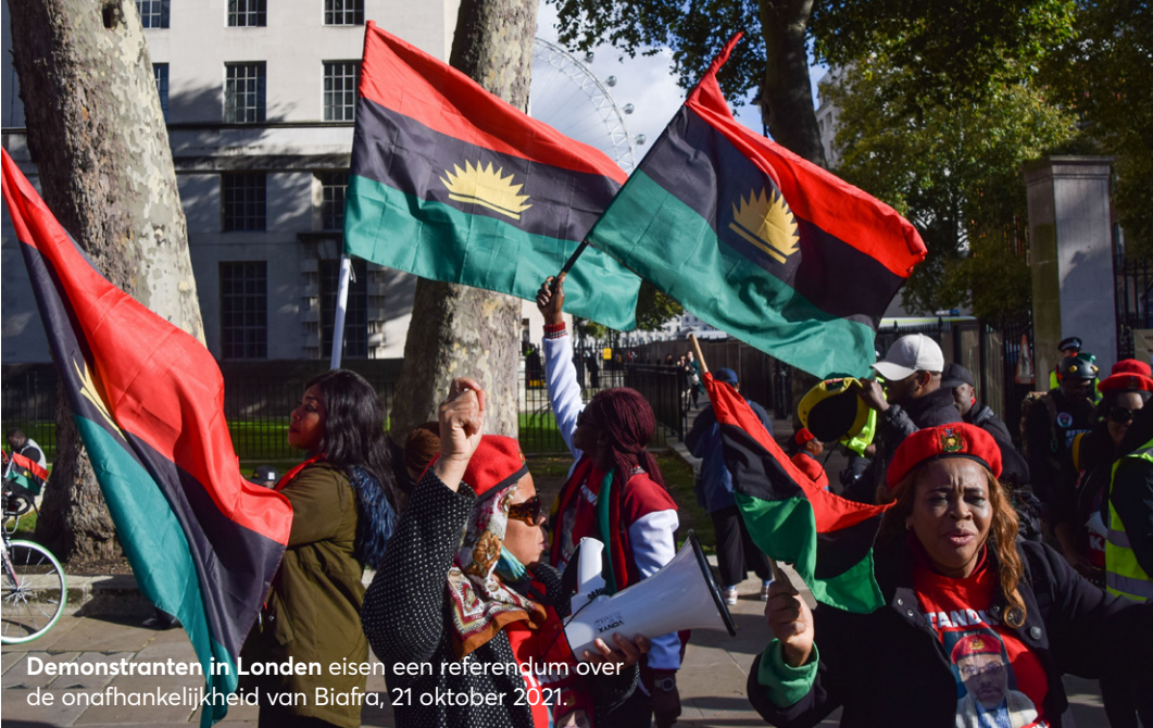
Demonstranten in Londen eisen een referendum over de onafhankelijkheid van Biafra, 21 oktober 2021.