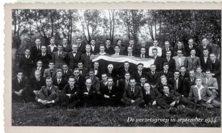
De verzetsgroep in september 1944.