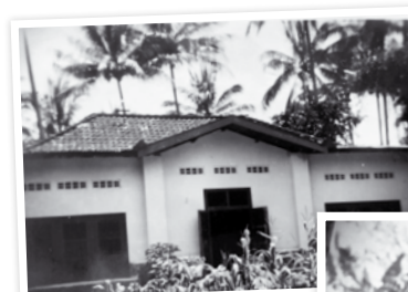
Het huis in Linggarjati. Op 15 november 1945 werd hier een eerste akkoord gesloten tussen Nederland en de Indonesiërs over hun onafhankelijkheid.