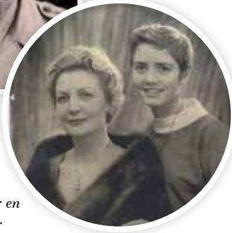
Moeder en dochter in 1946