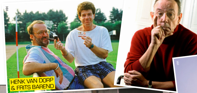
HENK VAN DORP & FRITS BAREND

Wat collega's vooral herinneren? Diezelfde Ruud Gullit kwam jaren nadien nog eens op de redactie van Nieuwe Revu. De stemming was uitgelaten, tot Gullit zei: 'Zeg Henk, ik snap iets niet helemaal. Frits stelt de vragen, Frits zit hier te tikken... Wat dóe jij nou eigenlijk? Ja, je rookt je pijp.' Vermoedelijk heeft Van Dorp gemompeld dat mijmeren een belangrijk onderdeel van de journalistiek was. Verder was de redactie getuige van een knetterende ruzie tussen het duo en de hoofdredactie nadat niet hun interview met Cruijff de cover was geworden, maar een groot portret over hun aartsrivaal Louis van Gaal.