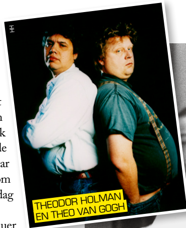
THEODOR HOLMAN EN THEO VAN GOGH